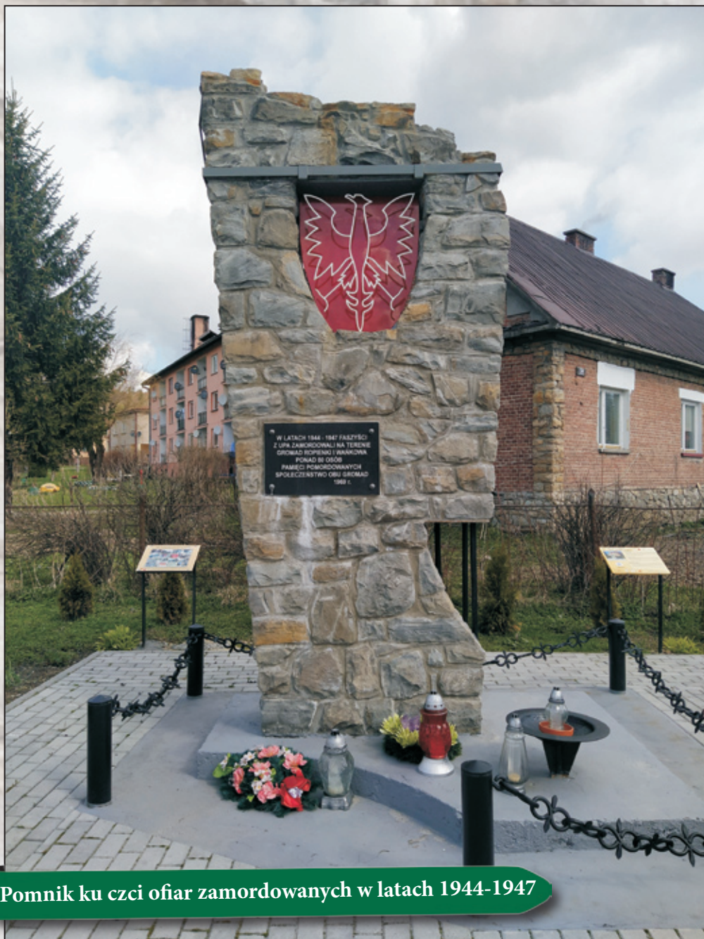
Pomnik ku czci ofiar zamordowanych w latach 1944-1947