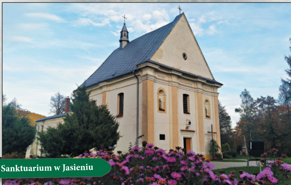
Sanktuarium w Jasieniu