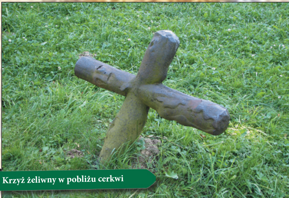
Krzyż żeliwny w pobliżu cerkwi