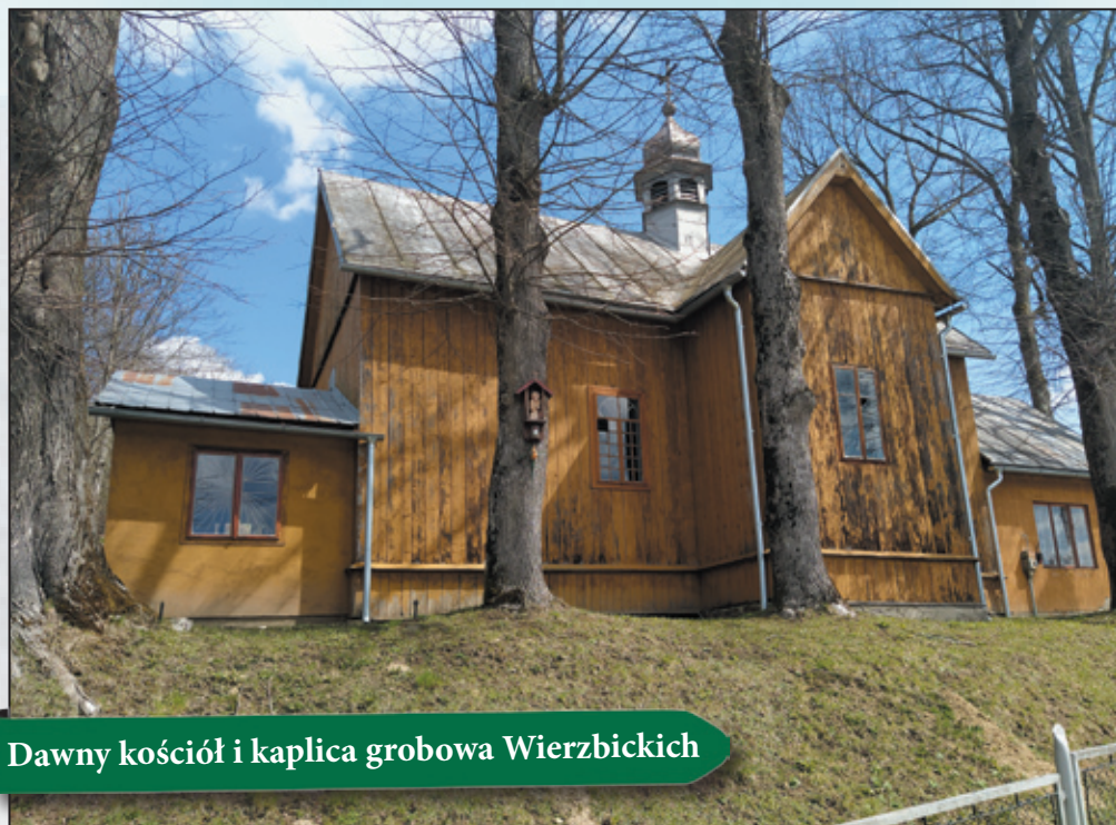
Dawny kościół i kaplica grobowa Wierzbickich