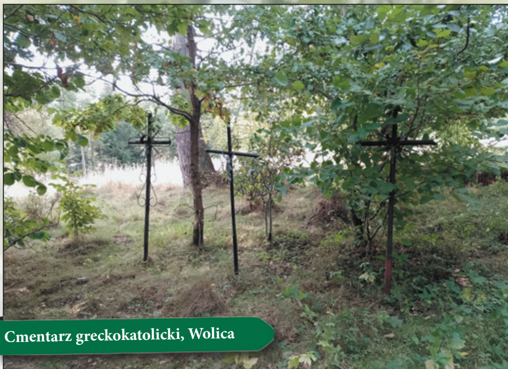
Cmentarz greckokatolicki, Wolica