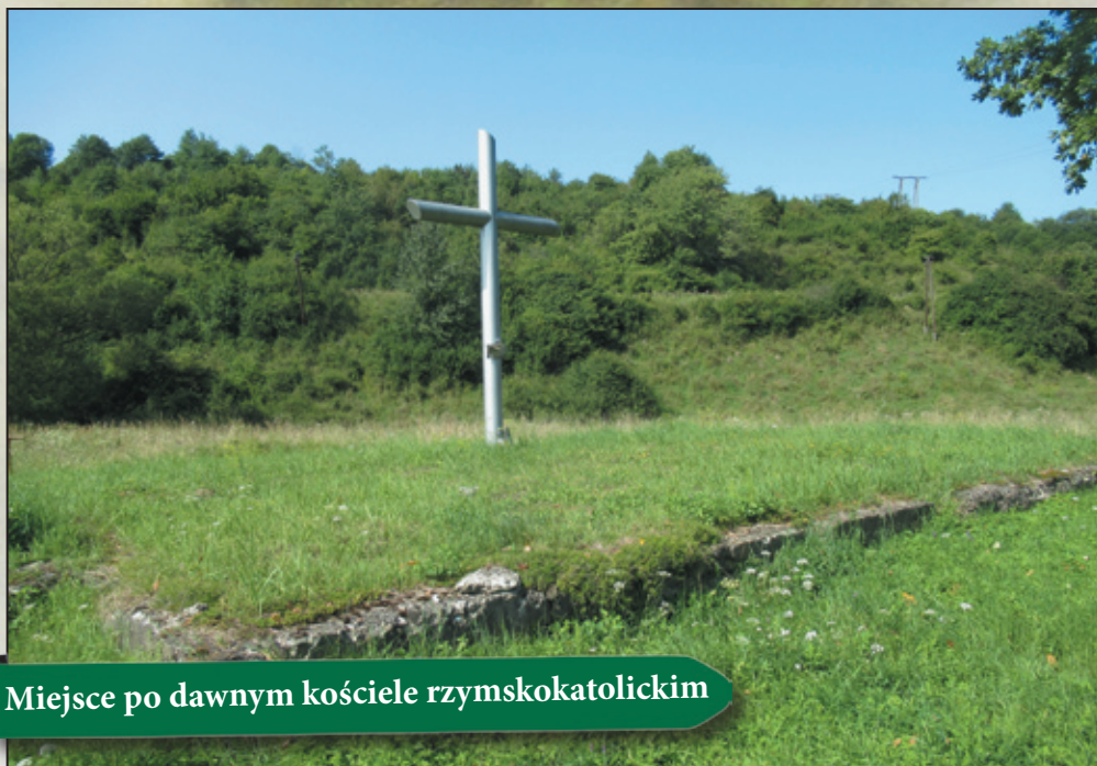
Miejsce po dawnym kościele rzymskokatolickim