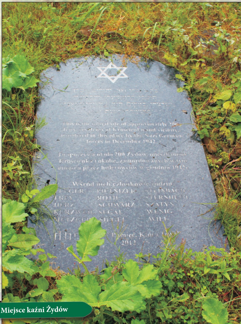
Miejsce kaźni Żydów