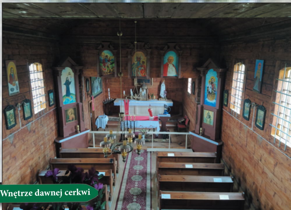
Wnętrze dawnej cerkwi