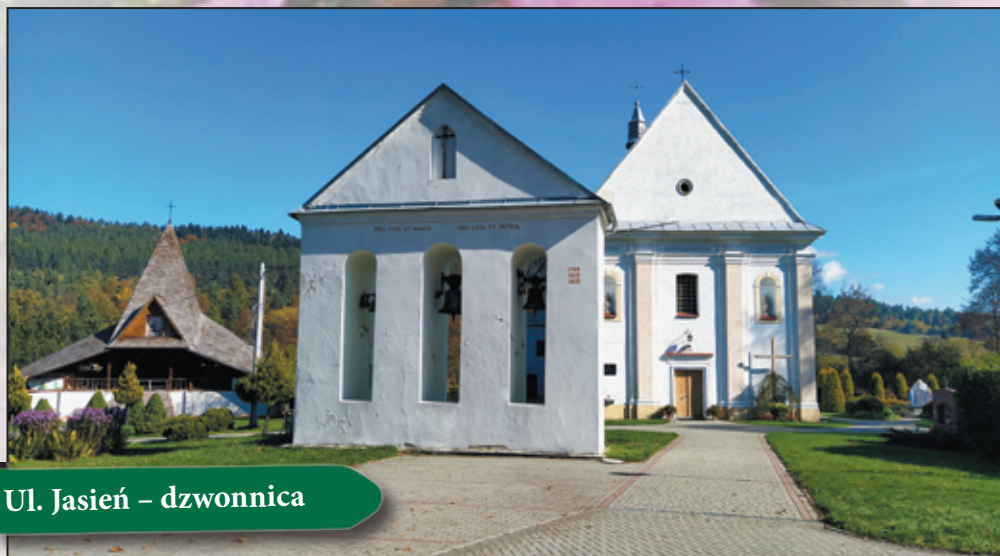
Ul. Jasień – dzwonnica