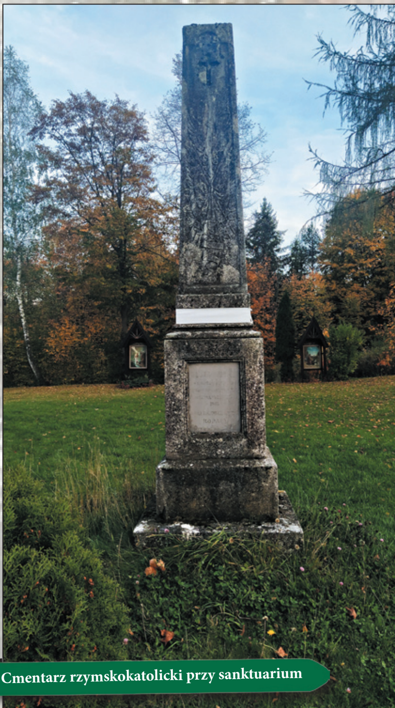
Cmentarz rzymskokatolicki przy sanktuarium