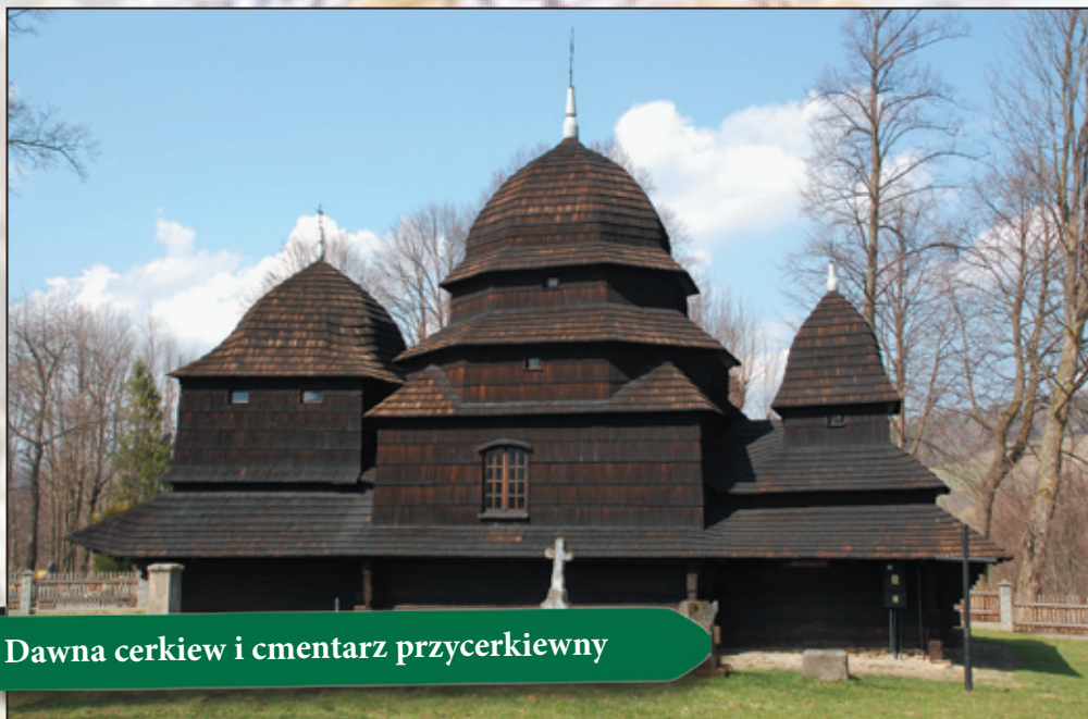
Dawna cerkiew i cmentarz przycerkiewny