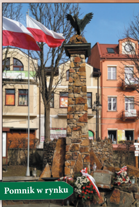
Pomnik w rynku