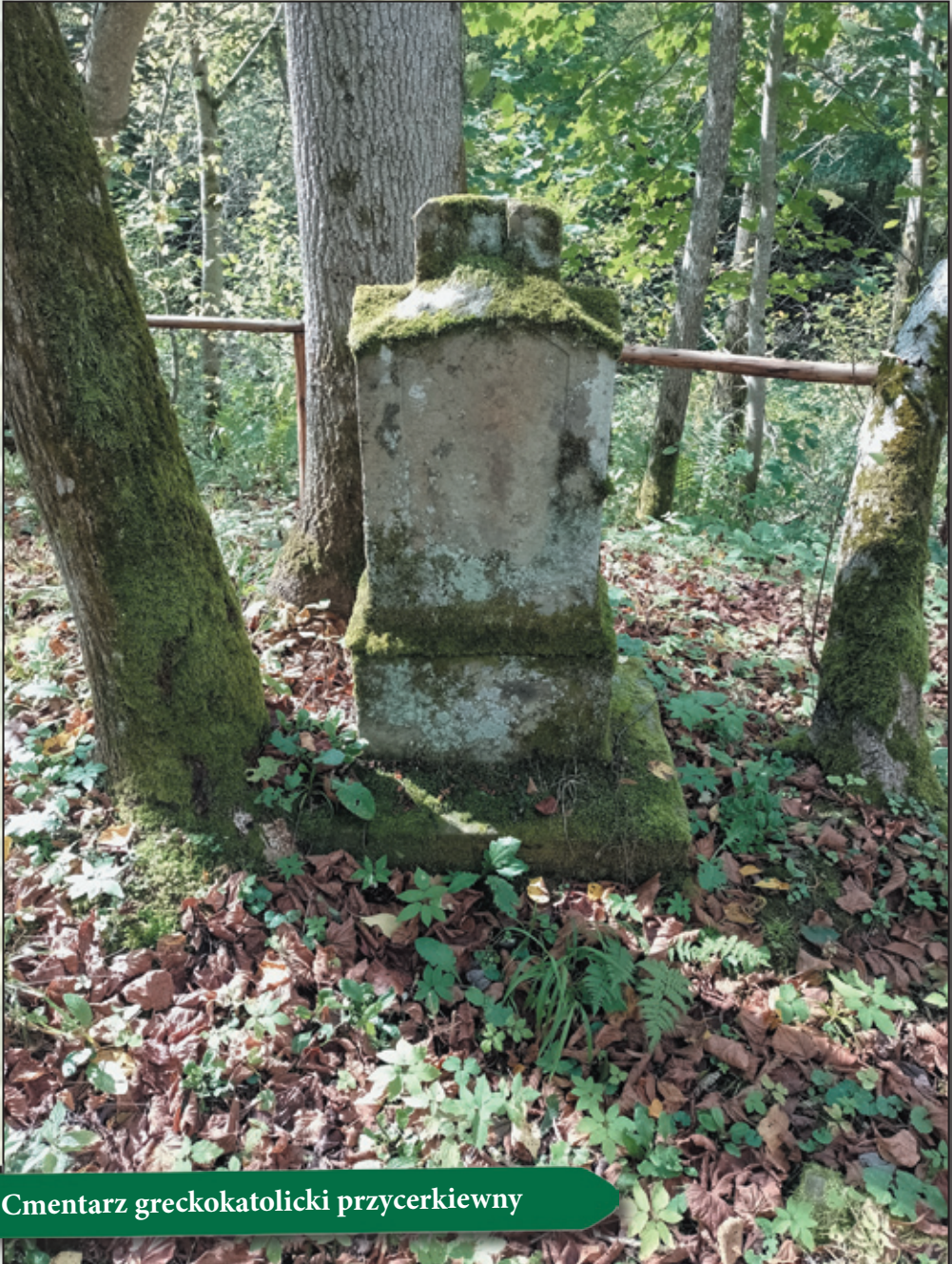
Cmentarz greckokatolicki przycerkiewny