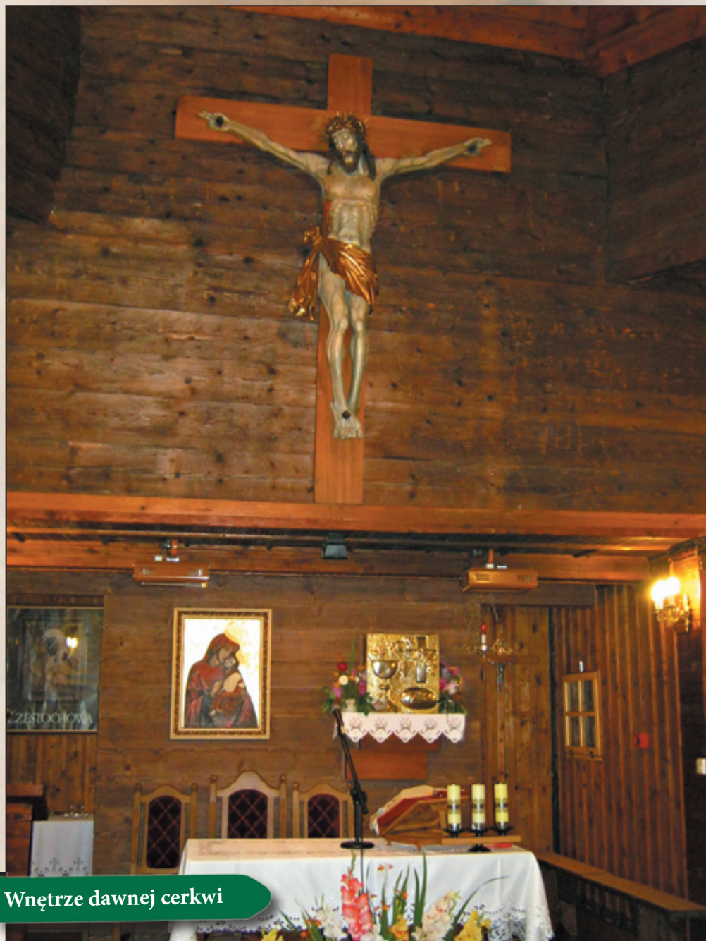
Wnętrze dawnej cerkwi