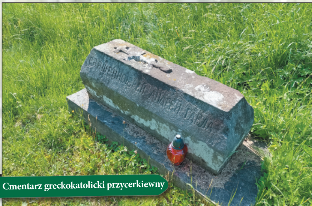
Cmentarz greckokatolicki przycerkiewny