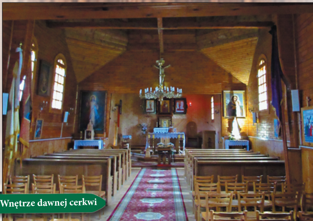
Wnętrze dawnej cerkwi