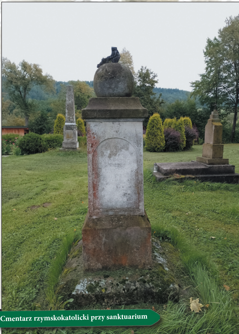
Cmentarz rzymskokatolicki przy sanktuarium