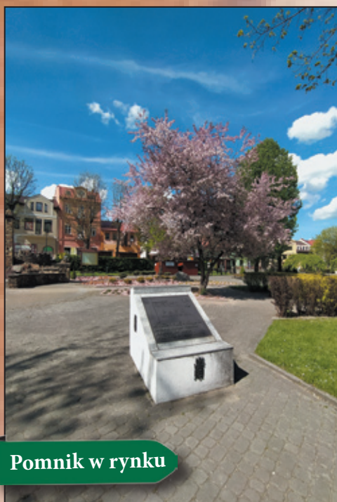
Pomnik w rynku