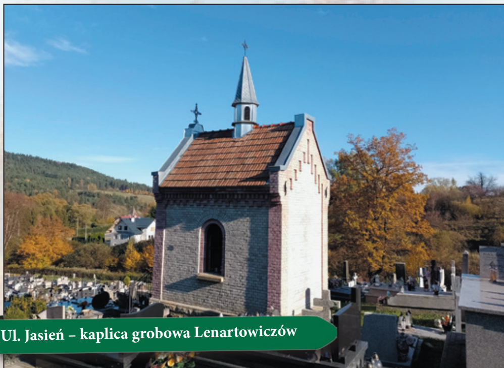
Ul. Jasiń – kaplica grobowa Lenartowiczów