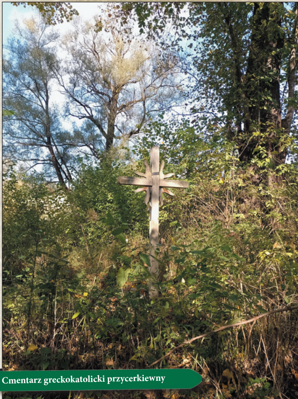
Cmentarz greckokatolicki przycerkiewny