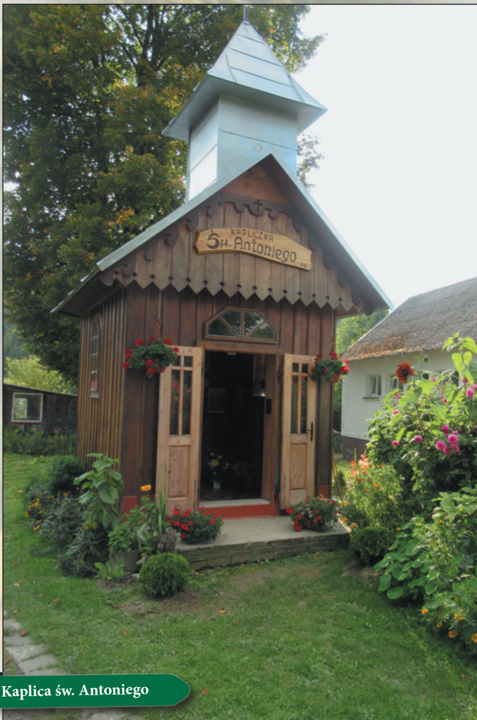
Kaplica św. Antoniego