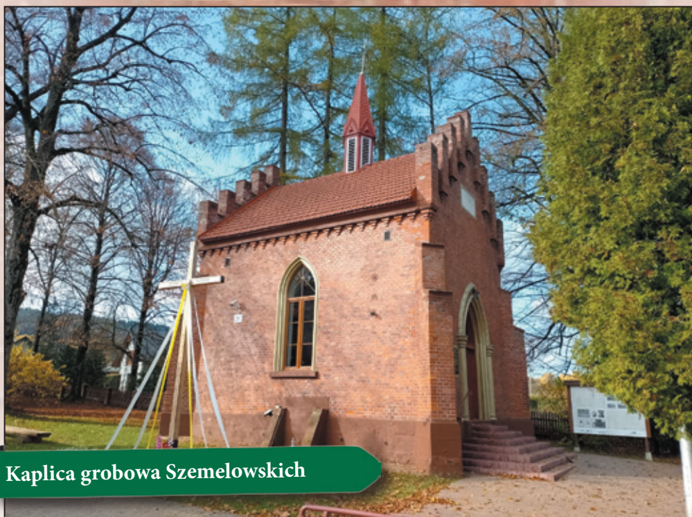
Kaplica grobowa Szemelowskich