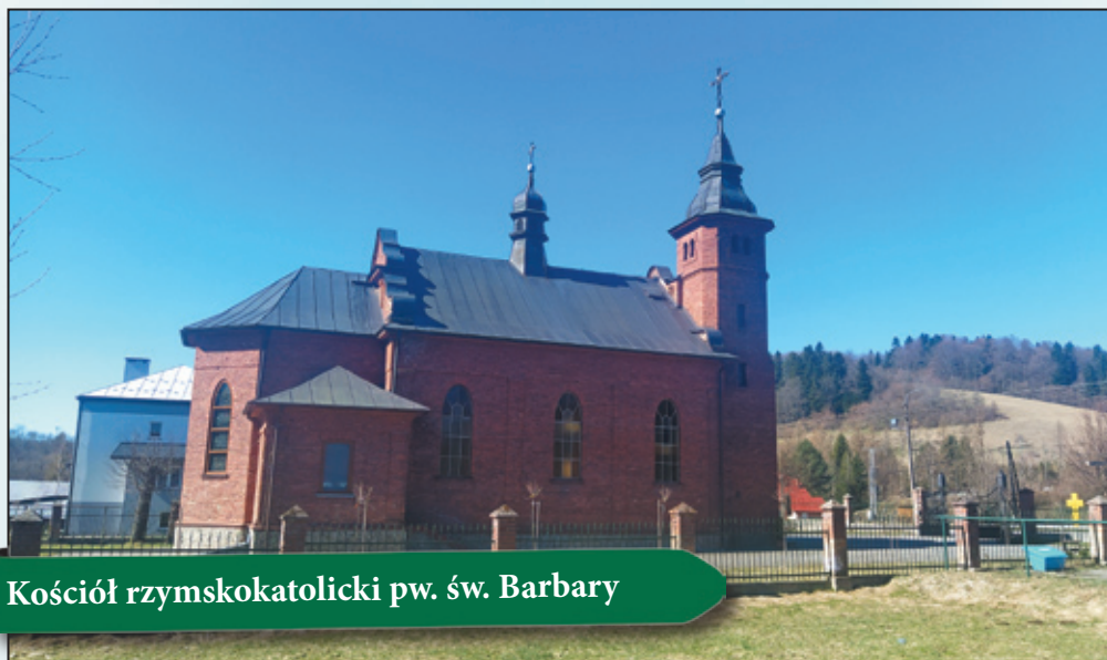
Kościół rzymskokatolicki pw. św. Barbary