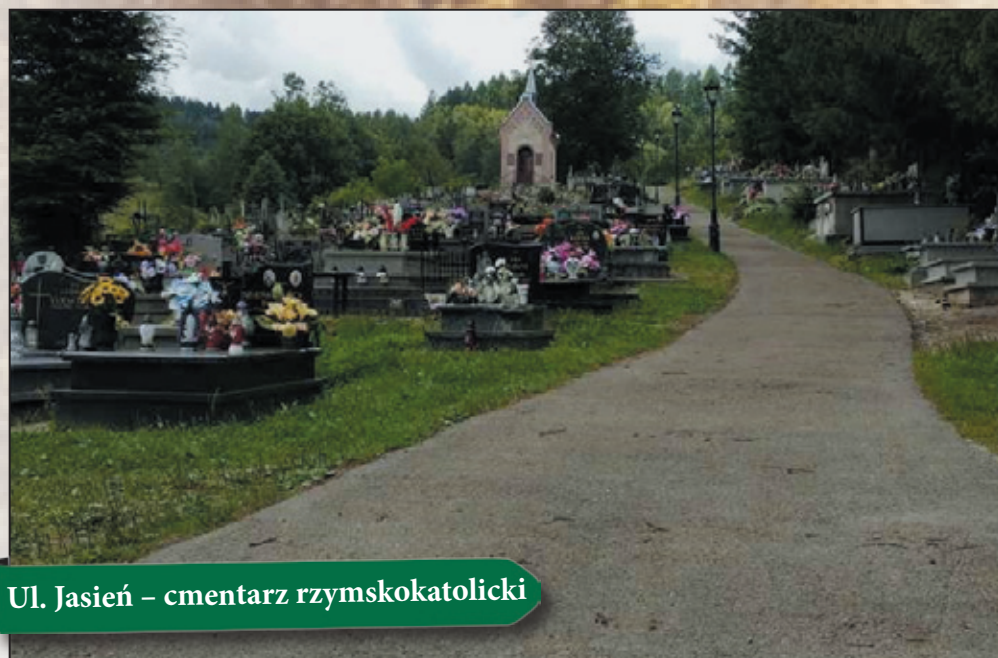
Ul. Jasiń – cmentarz rzymskokatolicki