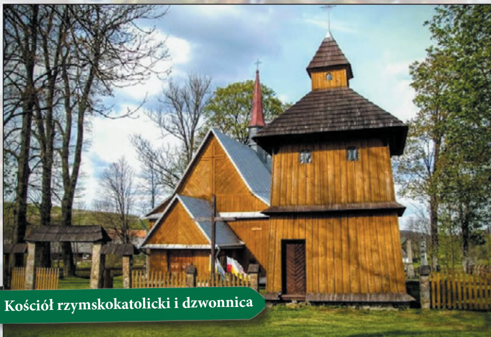
Kościół rzymskokatolicki i dzwonnica