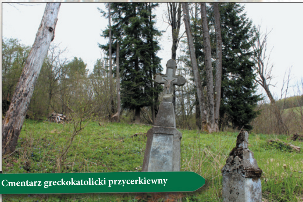
Cmentarz greckokatolicki przycerkiewny